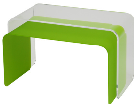
<PALETTE (Low Table)>

エボニック デグサ ジャパン 株式会社 〒163-0938 東京都新宿区西新宿 2-3-1 新宿モリス 12F